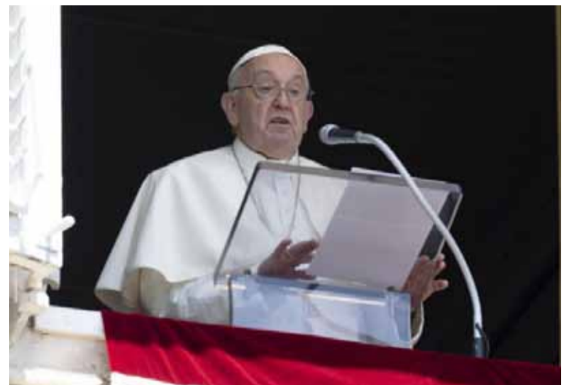
El papa Francisco en el rezo del Ángelus.

“Puede suceder que en lugar de escuchar realmente lo que el Señor tiene que decirnos, busquemos en él y en los demás solo una confirmación de lo que pensamos nosotros, de nuestras convenciones, de nuestros juicios, que son prejuicios”, indicó, al tiempo que afirmó que “la fe y la oración verdaderas abren la mente y el corazón, no los cierran”.